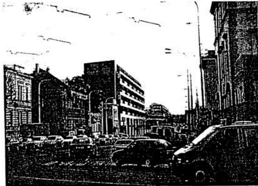
( tř. M. Horákové naproti Špejcharu )